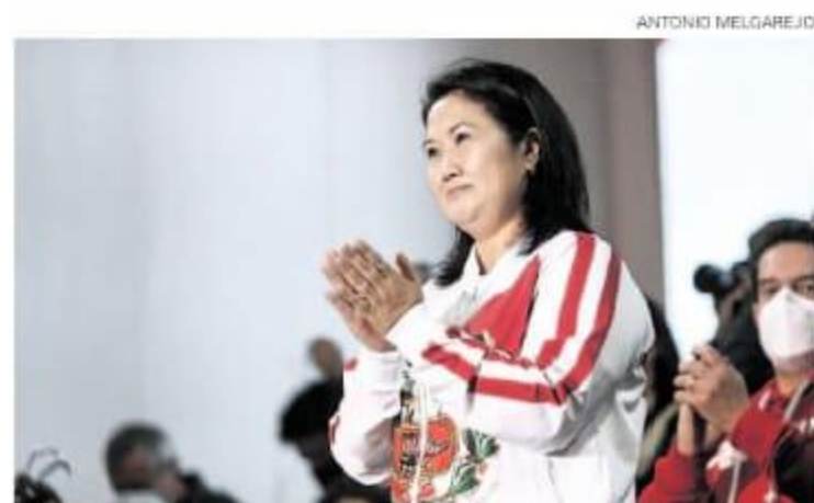
EXTREMO. Fujimori ha tornado su postura a ultraderecha.