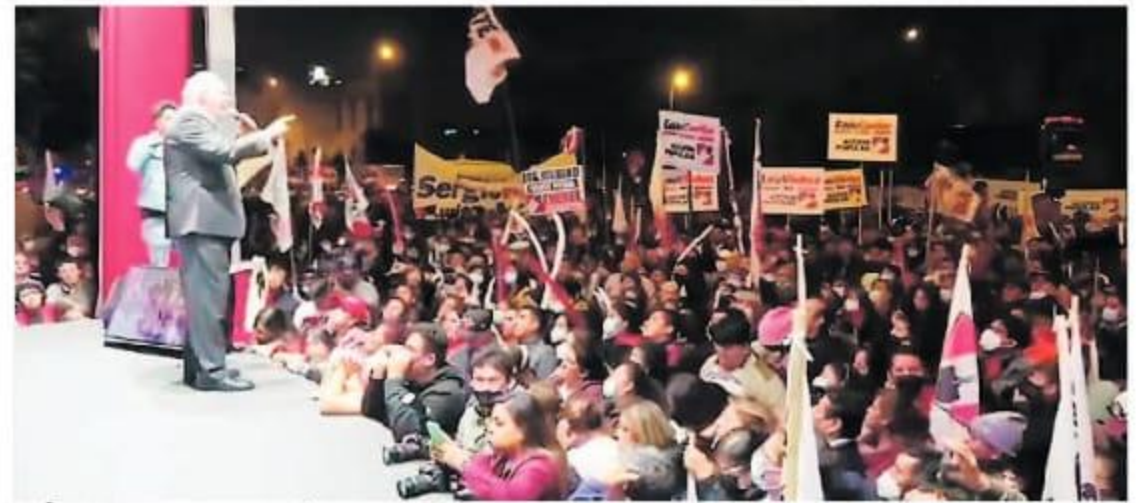
EFÍMERO. Los que anunciaron comicios no son dirigentes.

● Cronograma. La ONPE anunció haber contabilizado el 100% de actas de las internas del 15 y 22 de mayo. Las organizaciones tienen hasta el 14 para inscribir candidatos.